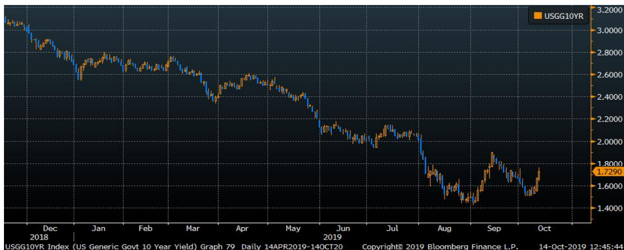
Динамика доходности 10-летних облигаций США

Рынки восприняли эту информацию ростом доходностей (падением цены) основного бенчмарка – 10-летние облигации Казначейства США выросли по итогам недели на 20 б.п.: с открытия на уровнях в 1,5%, неделя завершилась на уровнях немного выше 1,7%.