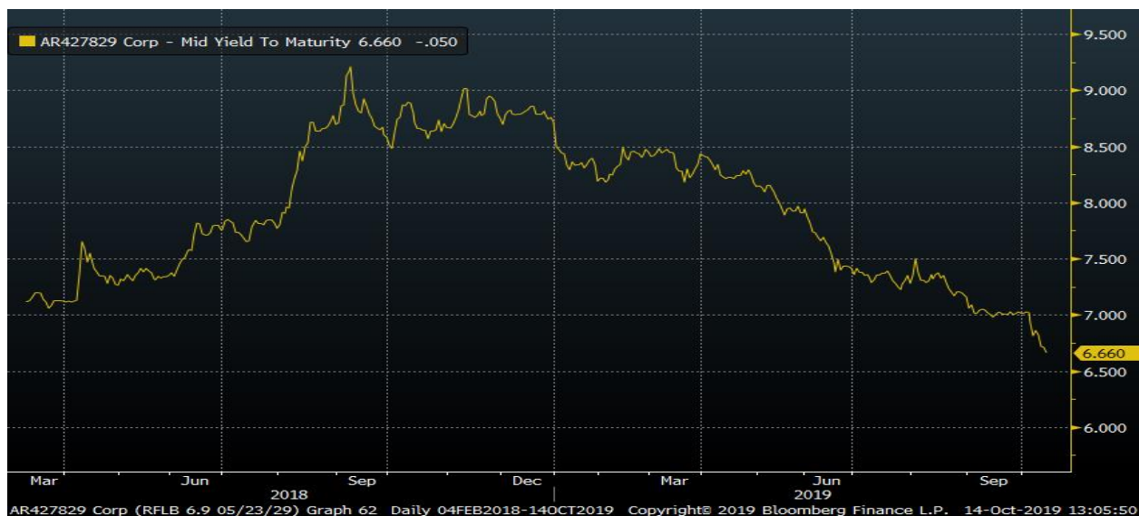
Динамика доходности 10-летних ОФЗ (выпуск 26224)

Важно отметить, что на этом фоне доходности большинства еврооблигаций почти не изменились – по-крайней мере, ни на одном из сегментов рынка еврооблигаций не наблюдалось столь же выраженного роста доходности, даже напротив. В сегменте российских ОФЗ рост цен (падение доходностей) продолжалось всю прошедшую неделю: преодолев по 10-летним бумагам доходность в 7,00, неделя завершалась вблизи отметки по доходности в 6,65.