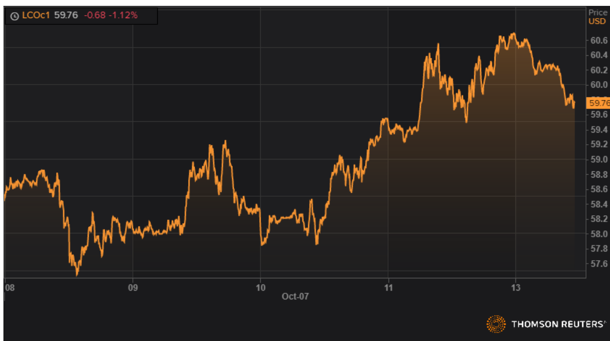
Динамика фьючерса марки Brent.

Цена на нефть марки Brent выросла на 1,88% до уровня 60 долларов, закрывшись на уровне 60,62 доллара за баррель. WTI вырос на 1,85% до 54,80 доллара за баррель. Этим утром оба контракта были под давлением, поскольку детали предполагаемой торговой сделки оказались не такими уже и позитивными.