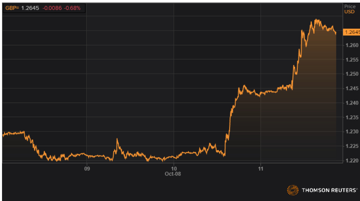
Динамика GBPUSD. Источник Reuters