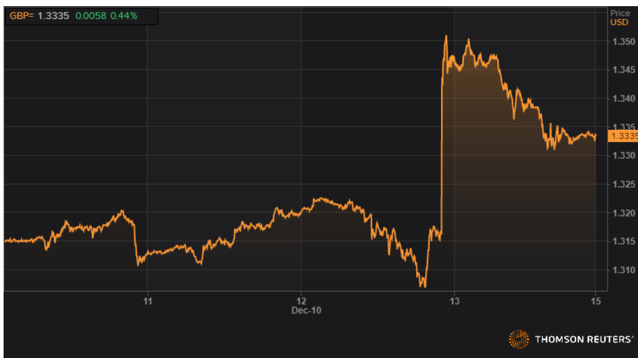
Динамика GBPUSD.

Фунт стерлингов вырос на 1,24% до $1,3335 к доллару, ранее достигнув отметки $1,3516.