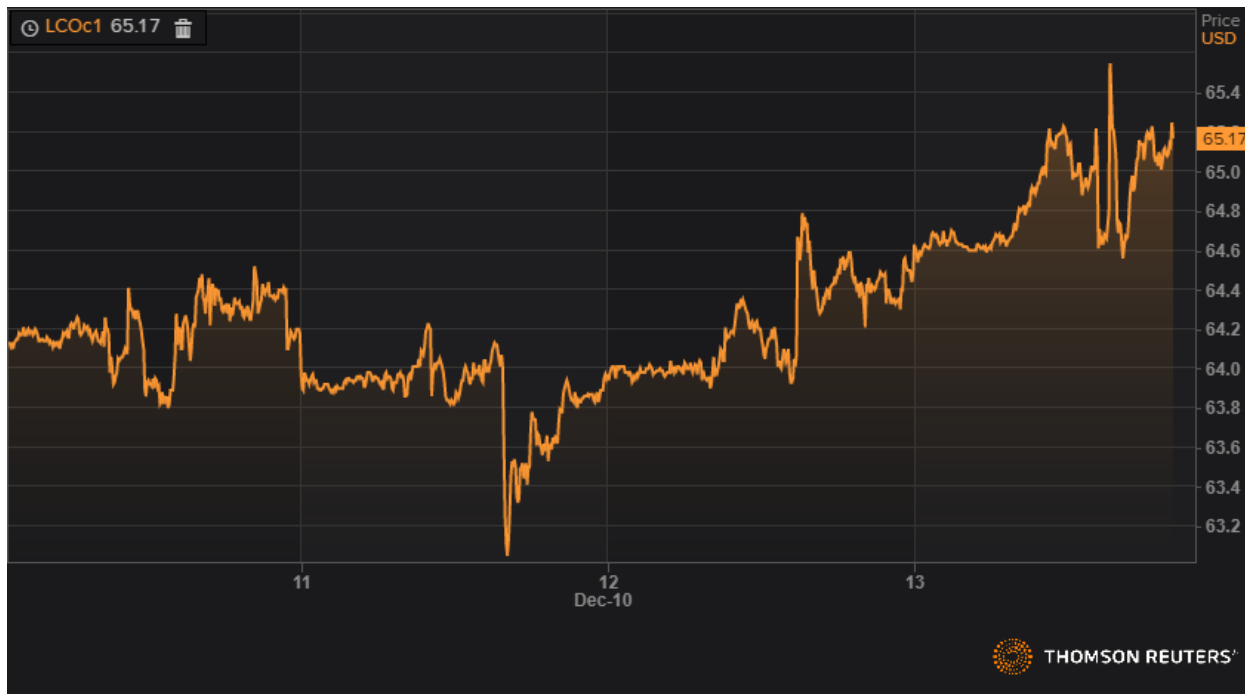
Динамика фьючерса марки Brent.

Нефть марки West Texas Intermediate выросла на 1,5%, до 60,03 доллара за баррель, нефть марки Brent прибавила 1,6%, до 65,17 доллара за баррель.