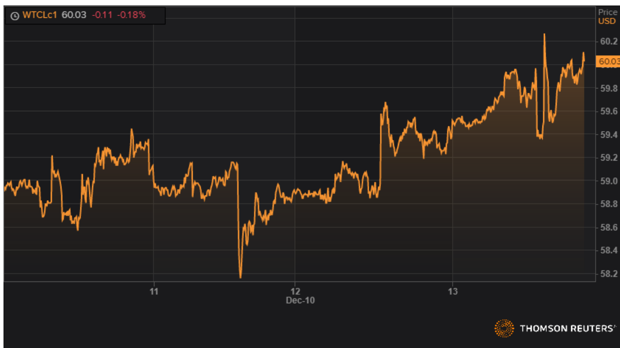
Динамика фьючерса марки WTI.