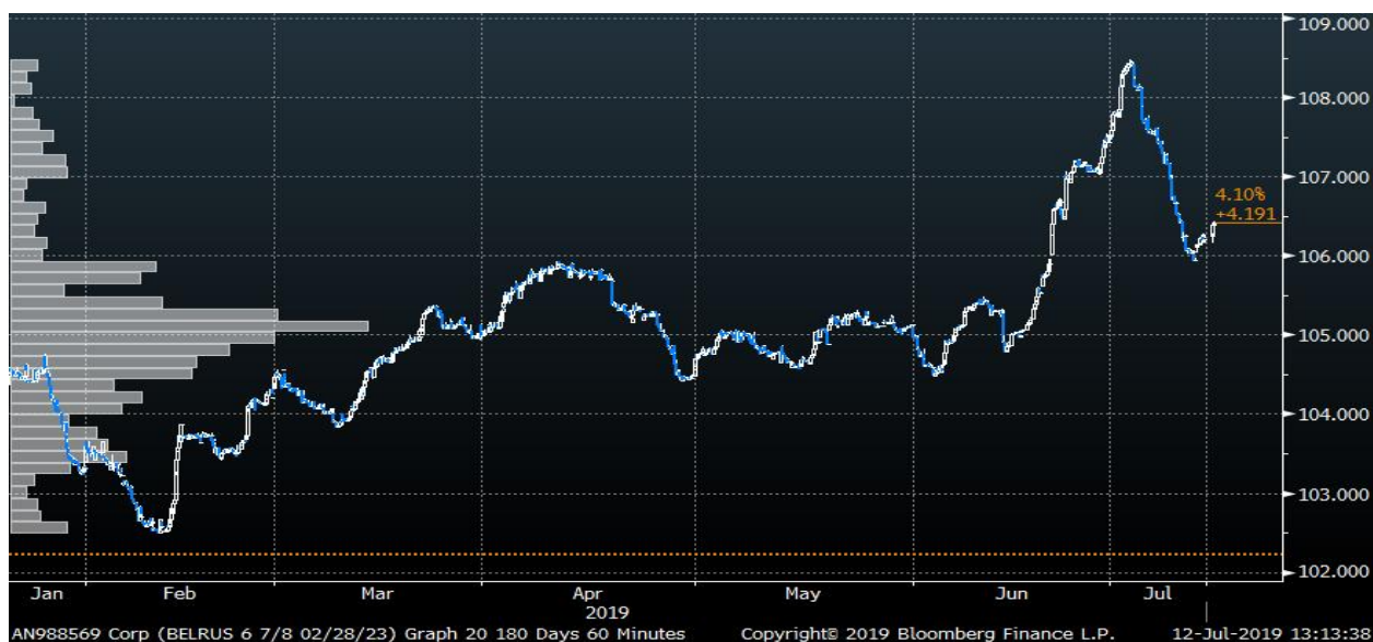
Динамика еврооблигаций Республики Беларусь (погашение 2023год)

Отметим и некоторую стабилизацию (рост в коротком выпуске) в сегменте еврооблигаций эмитентов Республики Беларусь.