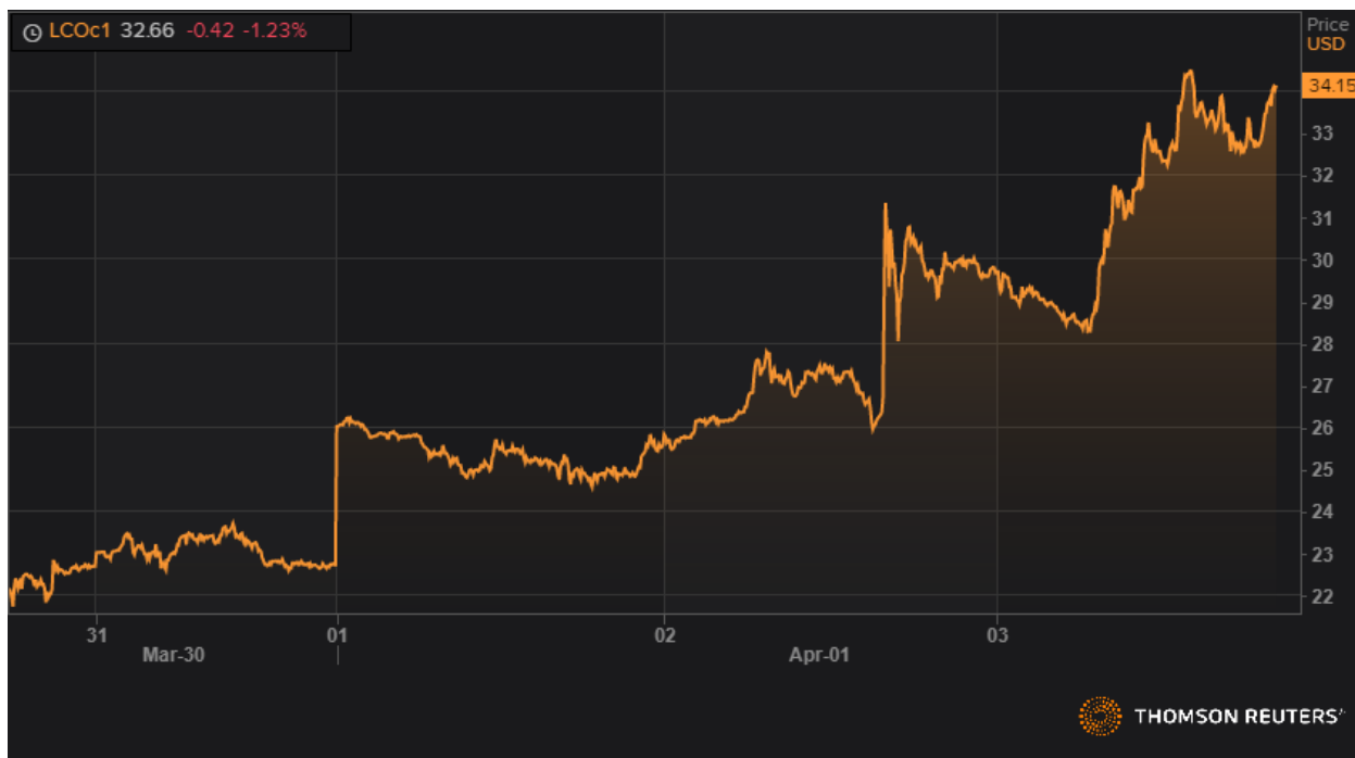
Динамика фьючерса марки Brent.

Нефть в пятницу пережила сильную сессию, так как надежды на сокращение добычи привели к росту нефти марки Brent на 15%, а WTI - на 12,25%. Из-за ссор и уклончивых заявлений России и Саудовской Аравии в выходные дни заседание ОПЕК+ было перенесено на четверг. Конечно, все, что связано с Россией и Саудовской Аравией, будет достигаться сложным путём. Оба совершенно справедливо говорят, что США должны быть включены в сделку, несмотря на юридические барьеры для этого. Канадцы и норвежцы также указывают, что они готовы внести свой вклад в соглашение