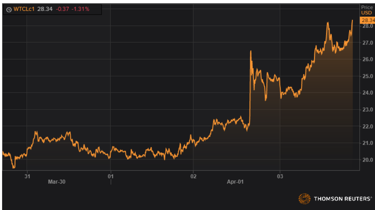
Динамика фьючерса марки WTI.