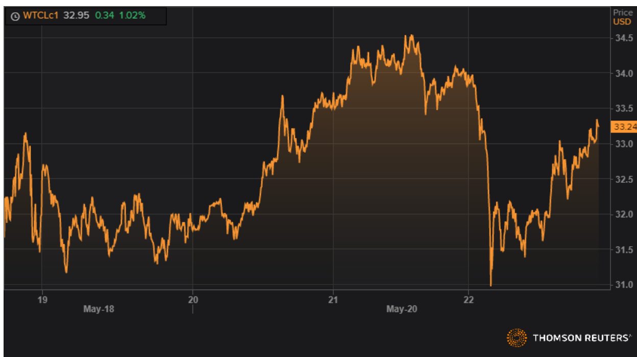
Динамика фьючерса марки WTI.