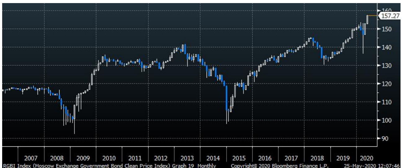
Динамика индекса RGBI (отслеживает динамику рынка ОФЗ)

В целом рынок в начале недели рынок долга стартует на следующих ценовых уровнях: