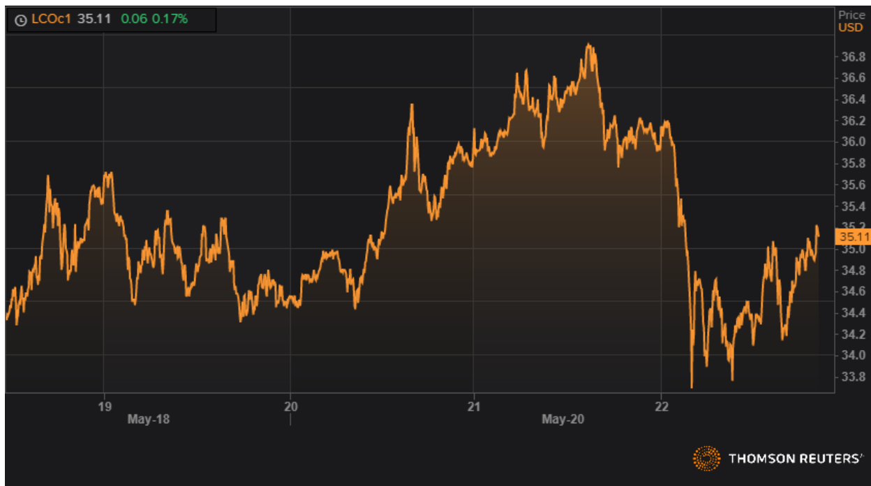
Динамика фьючерса марки Brent.