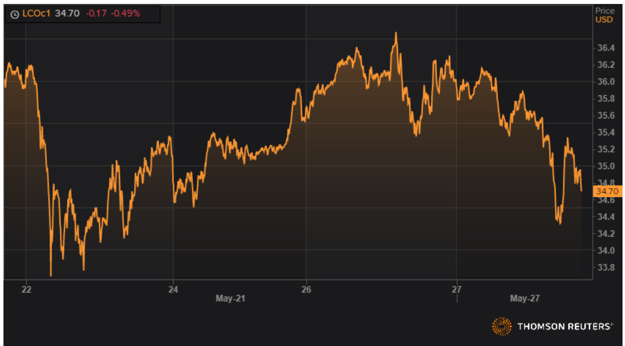
Динамика фьючерса марки Brent.

После недавних впечатляющих ралли нефтяные рынки выдохнули в среду, цены на сырую нефть вошли в коррекцию. Нефть марки Brent подешевела на 3,95% до 34,70 долл. за баррель, а цена на WTI снизилась на 4,50% до 32,80 долл. за баррель.